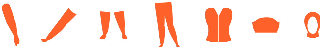
Therapeutische Elastische Kousen (TEK) voor arm, been en teenkappen, compressiebroek, compressie voor het midline-gebied (de torso, buik, rug en onderbuik) en hoofd-hals bandages.